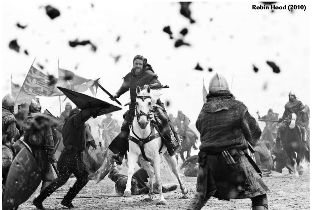
Robin Hood (2010)