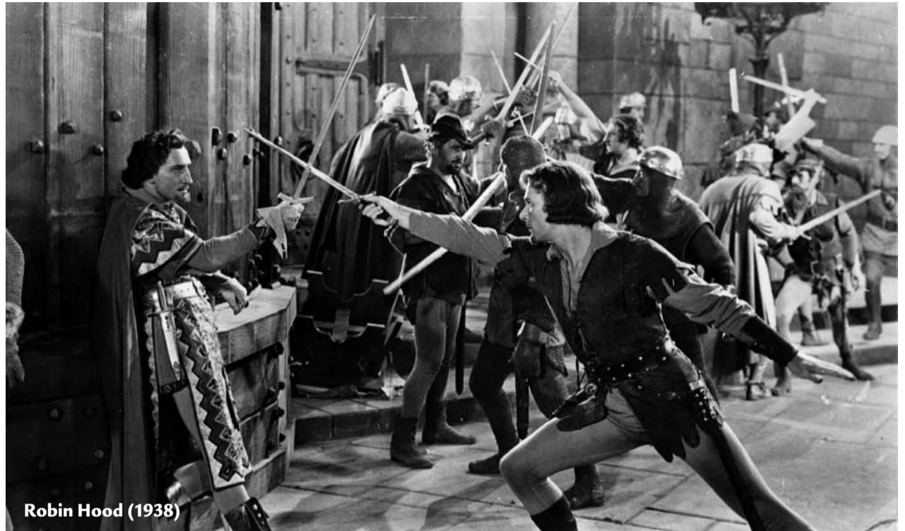
Robin Hood (1938)

elkobozza mindenét. (Érdekes, hogy ez a mozzanat belekerült Curtiz amúgy nem túl korhű feldolgozásába. A királyi palotában vagyunk. Egy kutya csontot marcangol. Erre a képre vágják rá János királyt, amint bekap egy falatot. Egy heves szópárbaj végén Locksley-t teljes vagyoneklobzással sújtja a király.) Nyilvánvaló, hogy a társadalmi szerződés ezt a folyamatot volt hivatott megakasztani. Brian Helgeland forgatókönyvíró ugyan utal ezekre a jelenségekre, de a hangsúlyt az életkörülményekre, a megélhetésre teszi át. Egyébként ilyen jellegű kitélt, amiről a filmben szó van, nem tartalmazott az eredeti dokumentum, nem is tartalmazhatott, hiszen a szociális kérdések rendezése nem lehet egy ilyen dokumentum tárgya. Nem lehet? Nem lehet kimondani azt, csak egy hollywoodi filmben, hogy minden embert megillet, hogy a munkájából származó bevételéből előbb joga legyen magát és a családját eltartani, csak utána kelljen adót fizetnie. Nem, mert mára minden egyes fogalmat ötszáz oldalas külön dokumentumban kellene megmagyarázni. Megszorításokat és kitételeket kellene tenni, és kezelhetetlenül bonyolulttá válna a rendszer. De vajon szükség van-e valamiféle társadalmi minimum megfogalmazására?